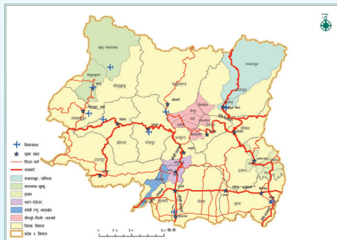
आर्थिक वृद्धि सम्भाव्य क्षेत्र - पर्यटन क्लस्टर