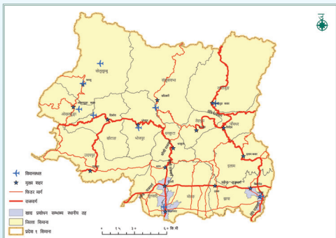
आर्थिक वृद्धि सम्भाव्य क्षेत्र - खाद्य प्रशोधन क्लस्टर