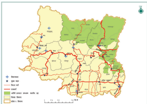
आर्थिक वृद्धि सम्भाव्य क्षेत्र - अलैंची क्लस्टर